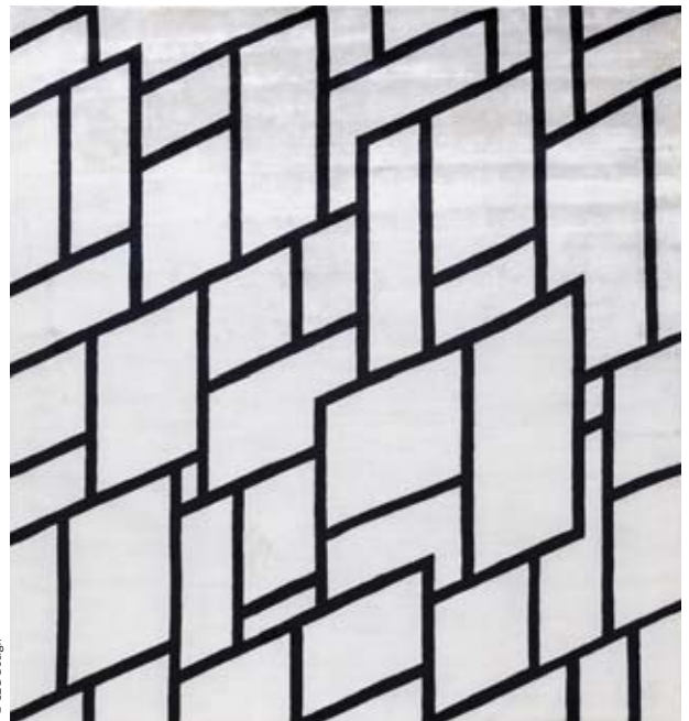
Tapis de Peter Peri