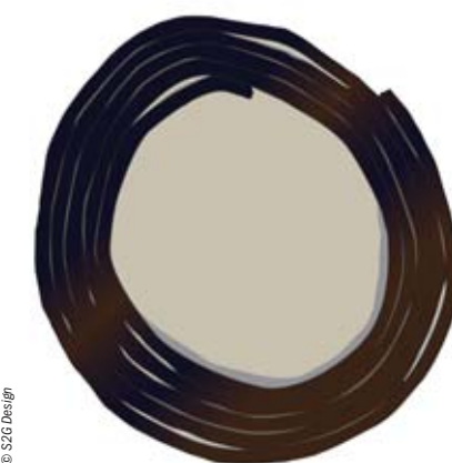
Maquette de Bernar Venet. Ligne indéterminée